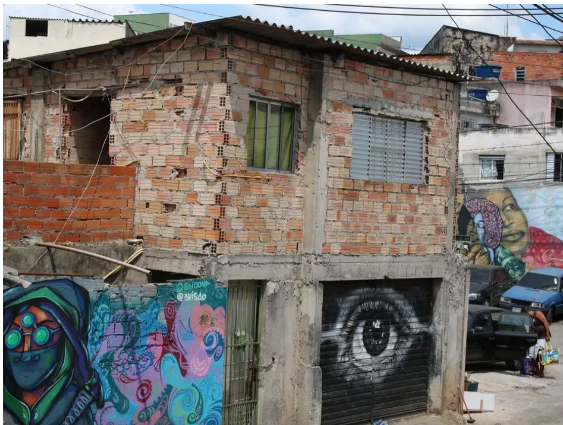
Obra reflete sobre a importância da infraestrutura em cidades das cinco regiões brasileiras

Pesquisa analisa impacto das infraestruturas urbanas nas cidades brasileiras, abordando planejamento, segregação e necessidade de inovação