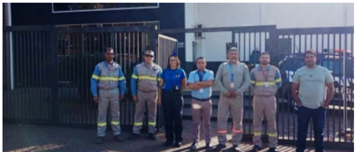
Ação da Polícia Civil contou com a colaboração de com servidores da Polícia Técnico-Científica e técnicos da Equatorial

A operação faz parte de um esforço contínuo das autoridades para garantir o uso correto dos serviços de energia e evitar prejuízos para a população e consequentemente para a concessionária.