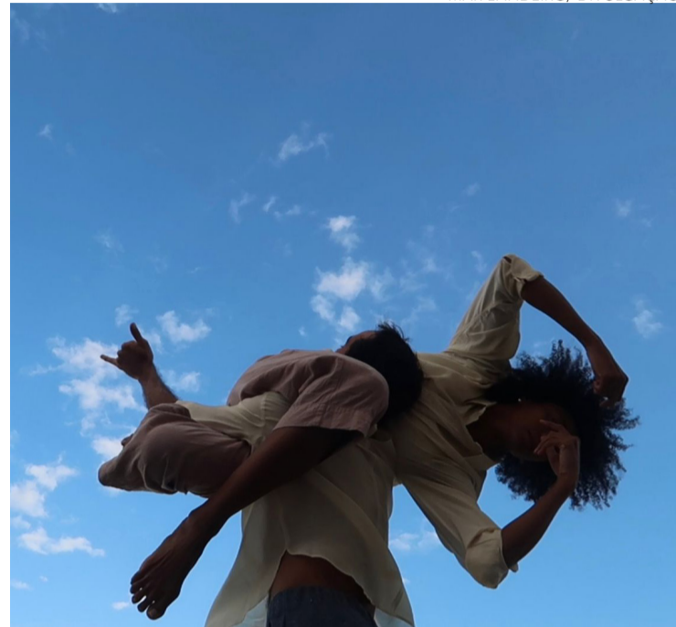
Obra não só busca entreter, mas também sensibilizar