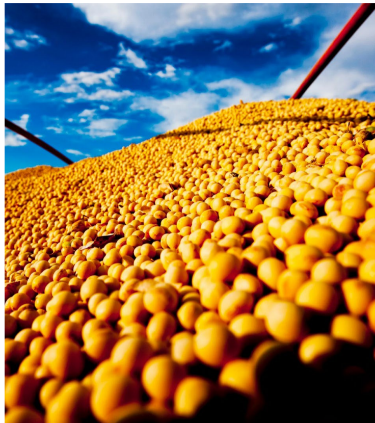
Desafios e oportunidades para a cadeia da soja serão debatidos na Embrapa em Londrina — Foto: Reprodução.

O seminário, exclusivamente presencial e com vagas limitadas, é promovido pela Embrapa Soja, em parceria com a Associação Brasileira das Indústrias de Óleos Vegetais (Abiove), a Associação das Empresas Cerealistas do Brasil (Acebra), a Associação Nacional dos Exportadores de Cereais (Anec), a Associação dos Produtores de Soja de Mato Grosso do Sul (Aprosoja-MS), a Associação das Supervisoras e Controladoras do Brasil (ASCB), a Organização das Cooperativas Brasileiras (OCB) e o Sindicato Nacional da Indústria de Alimentação Animal (Sindirações).