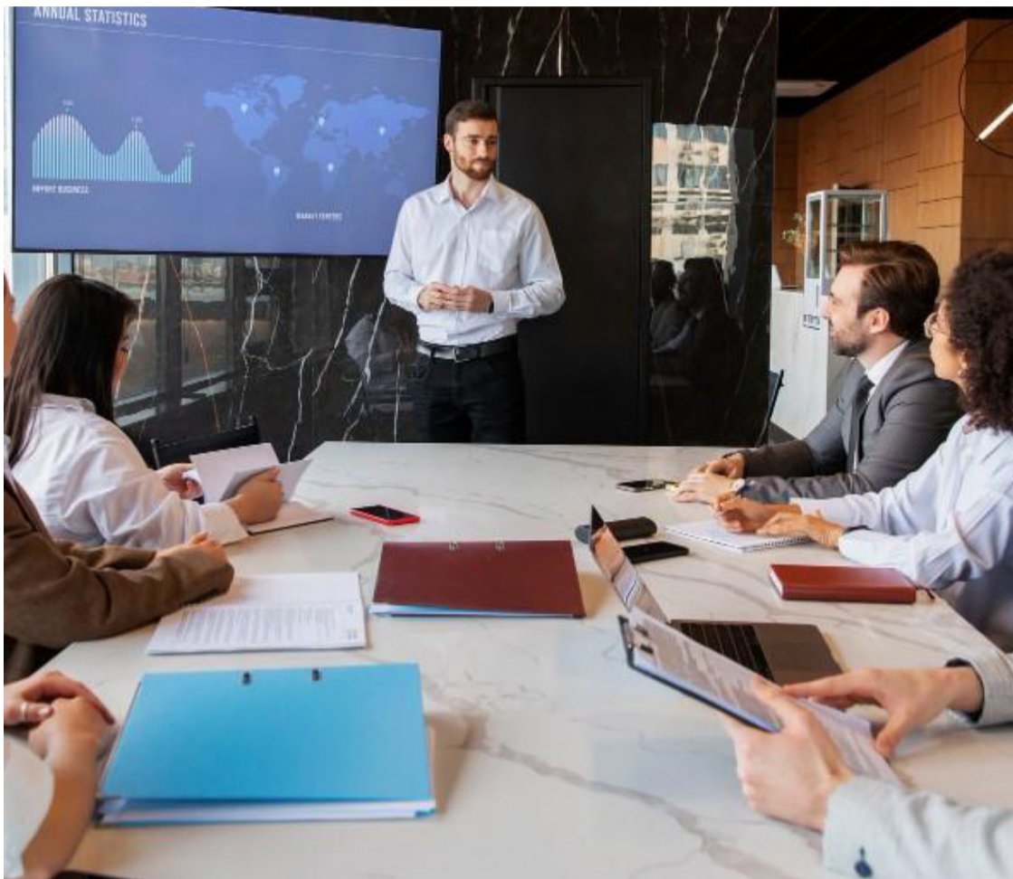
Forma como nos comportamos influencia percepção dos colegas no trabalho

A chave para relações profissionais de sucesso em reuniões de negócios, são momentos cruciais para o desenvolvimento de relações profissionais, negociação de acordos e tomada de decisões estratégicas. A forma como você se comporta durante essas reuniões pode influenciar significativamente a percepção dos colegas, parceiros e clientes sobre seu profissionalismo, competência e confiabilidade.