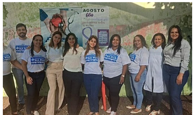
CREAS de Rio Verde homenageou moradores em situação de rua. Dia Nacional de Luta da População em Situação de Rua é comemorado em 19 de agosto

De acordo com a equipe que liderou a ação, essa iniciativa ocorre ao longo de todo o ano, buscando promover a dignidade e o cuidado com a população que vive nas ruas, oferecendo não apenas serviços de saúde e assistência, mas também momentos de cultura, reflexão e valorização pessoal.