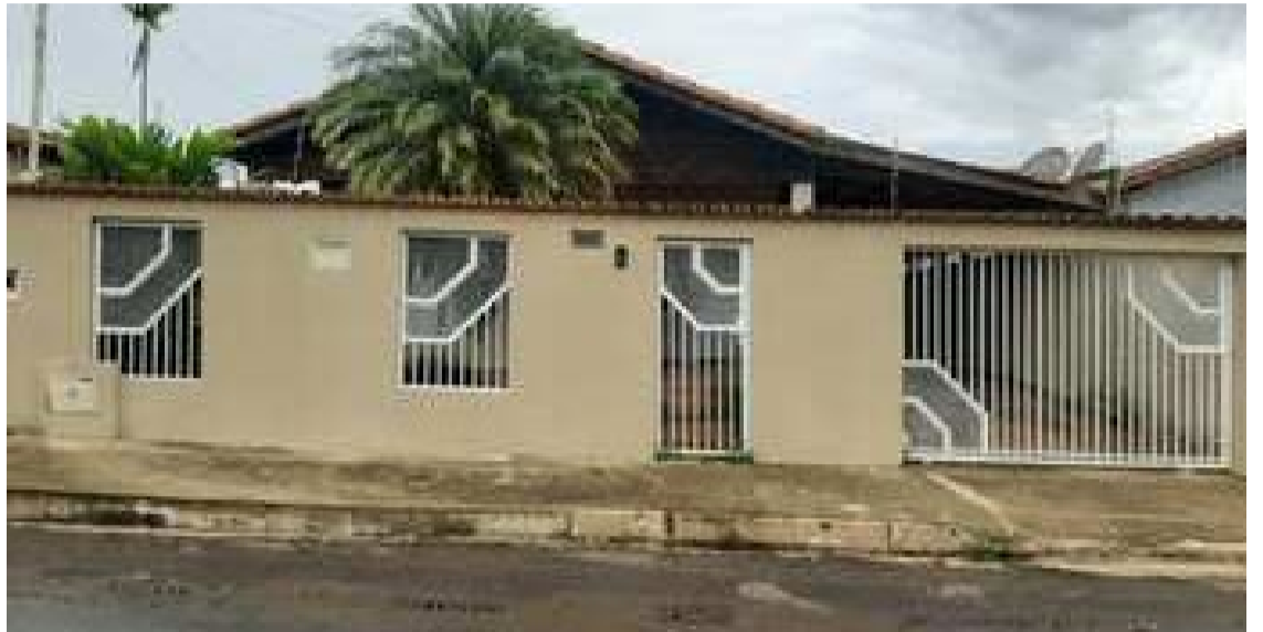
Casa no bairro Cohacol 1: Moradores relataram falta de água por mais de 24 horas na região nesta terça-feira, 20/8 — Foto: Reprodução.

A Saneago informou que foi notificada sobre o problema na manhã de hoje e que enviou uma equipe técnica ao local para investigar a situação. A empresa disse que a falha pode estar relacionada a uma válvula reguladora de pressão, responsável por controlar a distribuição de água para o bairro. A equipe foi deslocada ao local por volta das 13h30 para realizar as verificações necessárias.