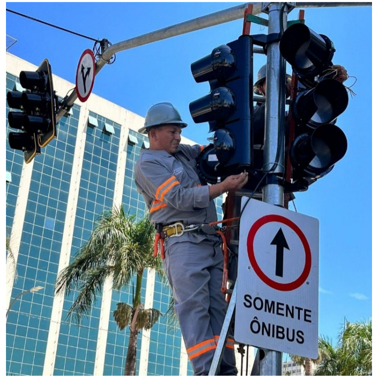
Configuração semafórica prioriza transporte coletivo e pedestres: travessias mais seguras

Paralelamente à conclusão do BRT Norte-Sul, a Prefeitura tem implementado projetos de reordenamento viário, com foco na melhoria do trânsito para veículos particulares e transporte coletivo, promovendo uma organização eficiente das vias públicas e beneficiando todos os atores envolvidos na mobilidade urbana da capital.