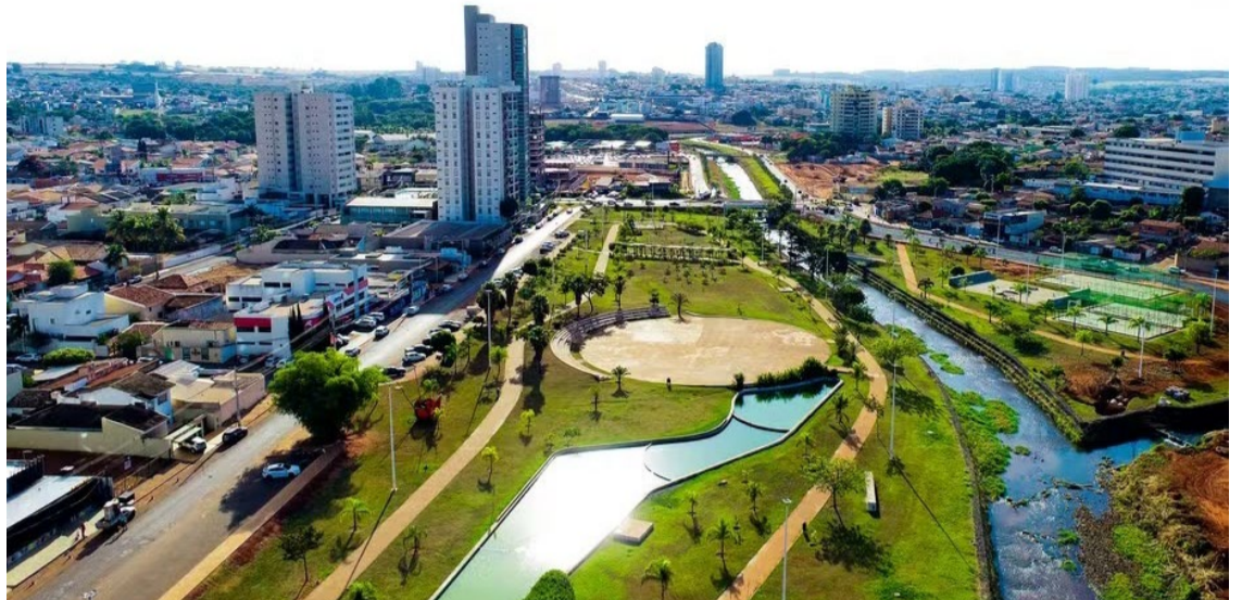
De janeiro a julho, o município de Rio Verde abriu 37.014 novos empreendimentos — Foto: Reprodução.

A JUCEG destacou que as atividades que mais atraíram os investidores foram os serviços combinados de escritório e apoio administrativo; treinamento em desenvolvimento profissional e gerencial; preparação de documentos e serviços especializados de apoio administrativo; e atividade médica ambulatorial restrita a consultas e atividades de consultoria em gestão empresarial.