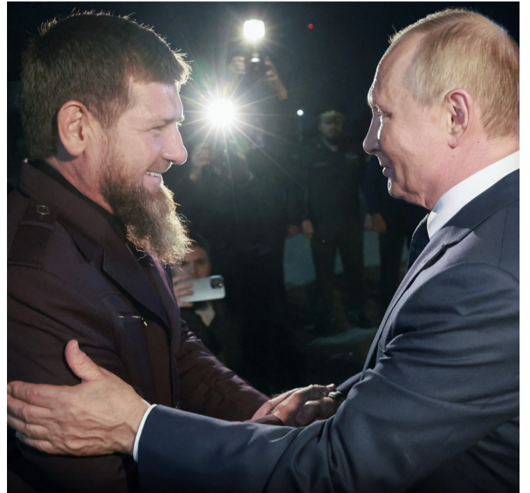
Viagem marca um momento importante nas relações entre o Kremlin e a Tchetchênia, especialmente considerando o histórico de conflitos

Sob a liderança de Ramzan Kadyrov desde 2007, a república tem sido criticada por violações de direitos humanos. A visita de Putin ocorre em um contexto de tensões regionais, com forças ucranianas lançando uma ofensiva surpresa na região russa de Kursk, em 6 de agosto, capturando várias localidades. Forças tchetchenas foram destacadas para Kursk em resposta a esse ataque, destacando a importância estratégica e militar da Tchetchênia.