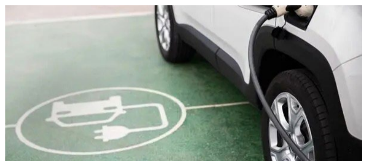
Novo serviço permite a regularização espontânea do IPVA para proprietários de veículos elétricos e híbridos domiciliados em Goiás — Foto: Reprodução.

Na última semana, por meio da Operação Quíron, uma ação conjunta entre Polícia Civil e Secretaria de Economia, foram identificados cerca de 500 proprietários domiciliados em Goiás que registraram seus veículos em outros estados utilizando endereços falsos ou irregulares para obter indevidamente a isenção do tributo.