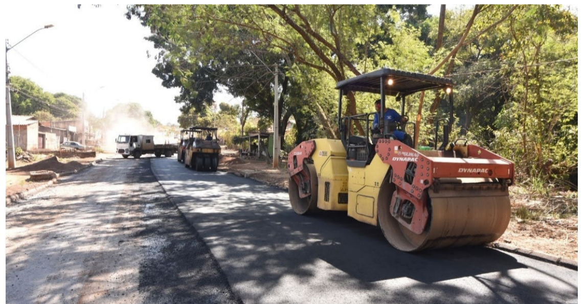
Celeridade na reconstrução asfáltica da Avenida La Paz, entre o Parque Industrial João Braz ao Conjunto Vera Cruz

A ação faz parte do Projeto 500 KM, que tem por objetivo reconstruir 500 quilômetros de malha viária em Goiânia.