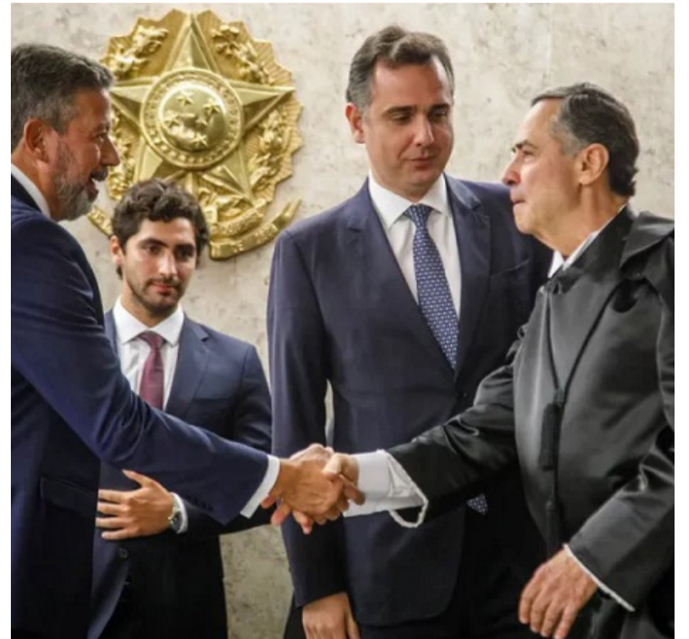
Arthur Lira, Rodrigo Pacheco e Luis Roberto Barroso: consenso sobre emendas parlamentares

Mais cedo nesta terça, Pacheco foi recebido por Lula num café da manhã no Palácio da Alvorada. O presidente do Senado também se reuniu com Lira para tratar do impasse das