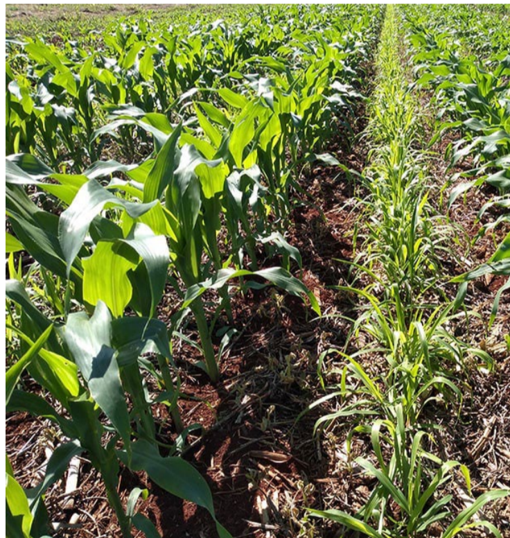
Diversificar culturas na sucessão entre milho e soja aumenta lucro do produtor em até 11%, diz estudo — Foto: Reprodução.

Os pesquisadores pretendem validar esses resultados em propriedades rurais e transferir a tecnologia para os produtores, visando promover a sustentabilidade e a rentabilidade do agronegócio na região.