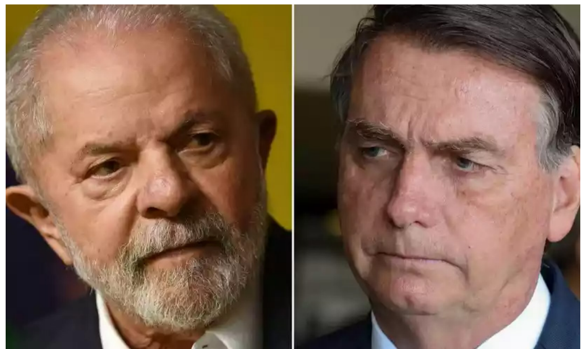
Lula da Silva e Jair Bolsonaro: disputa pelo protagonismo nas capitais

Envolto em uma crise desde a ascensão do bolsonarismo, o PSDB foi o partido que teve o maior baque no número de candidaturas a prefeito em números absolutos. Os tucanos tiveram 1.332 candidatos a prefeito em 2020 e terão 710 neste ano, uma queda de 47%.